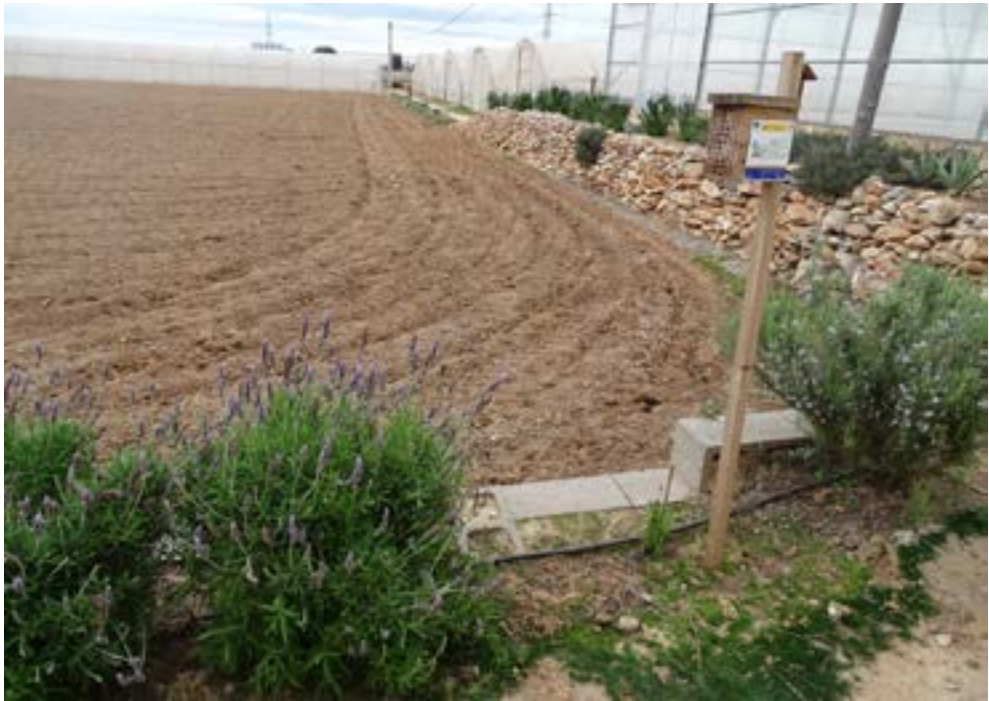
Medidas de fomento de polinizadores y fauna auxiliar en el marco del GO Ideas.