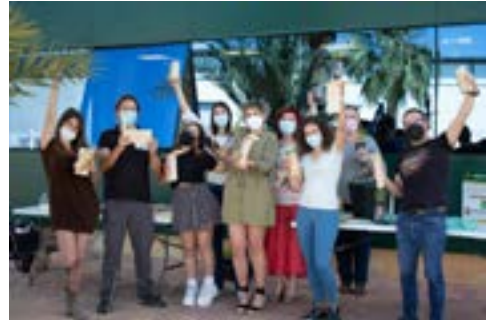
Voluntariado corporativo en la sede de Naturgreen (Librilla) con motivo del día mundial de las abejas de 2021.