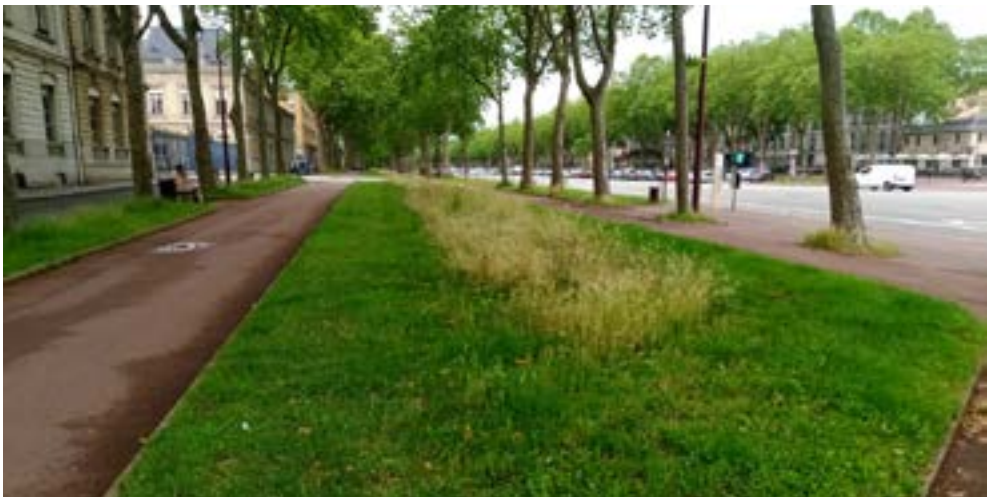
La reducción de la frecuencia de la siegas o dejar parches sin segar son medidas habitualmente recomendadas para la conservación de polinizadores. Versailles, Francia.