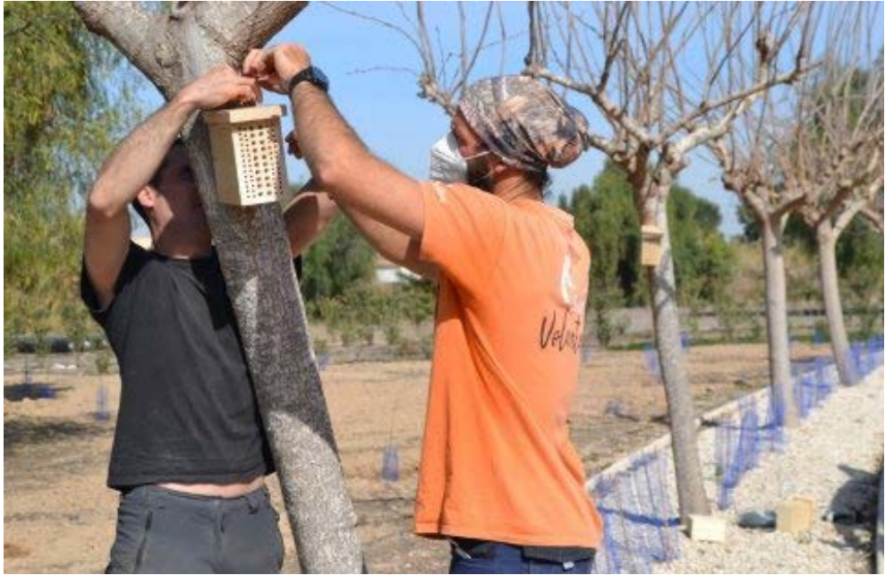
Actuaciones en Huertos Urbanos de Rojales (Alicante) instalación de refugios para polinizadores y se observa seto de plantas aromáticas bajo a la alineación de moreras.