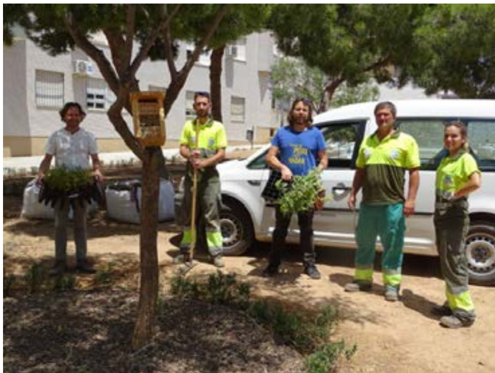
Plantación de especies atractivas para los polinizadores en el Jardín de La Roca (Cartagena).