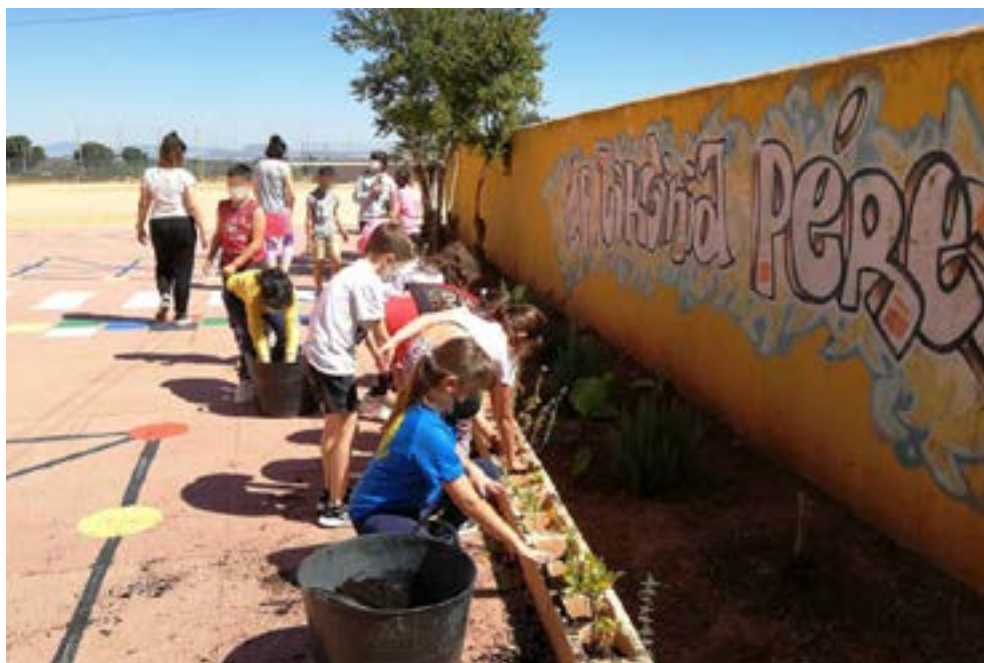
Alumnos introduciendo plantas atractivas para polinizadores en jardineras del patio (CEIP Virginia Pérez, El Algar).