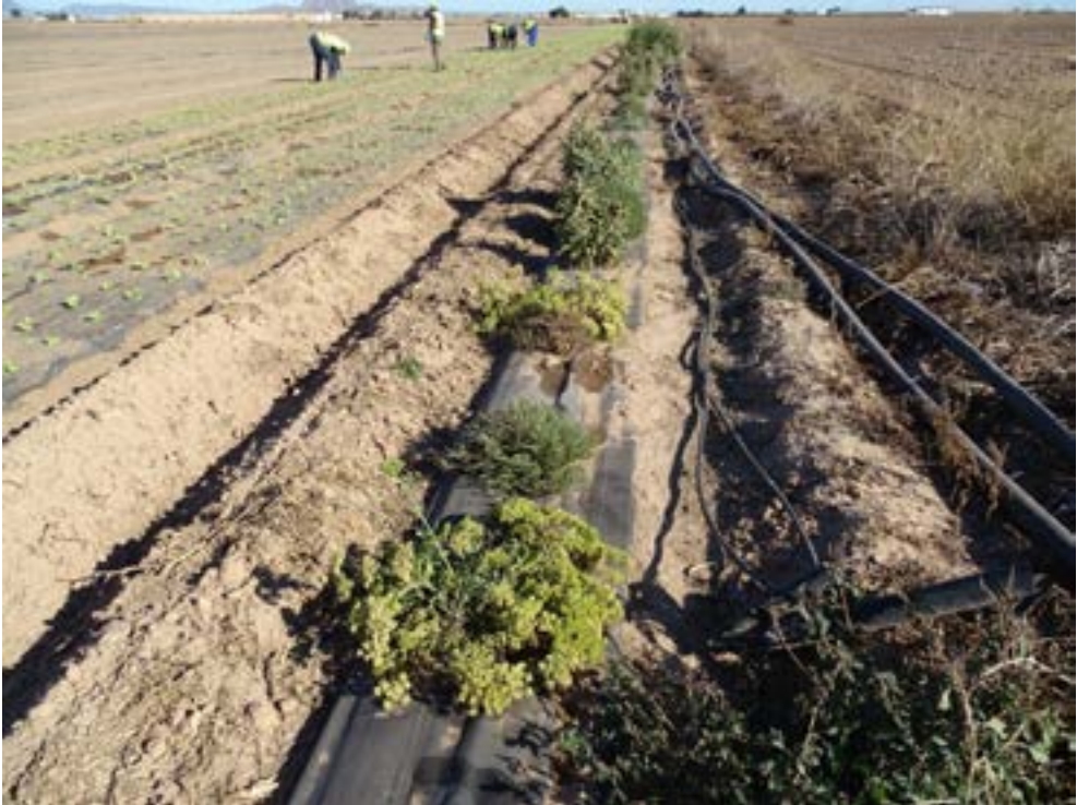
Seto con plantas atractivas para polinizadores anexo al ribazo pre-existente en el entorno del Mar Menor..