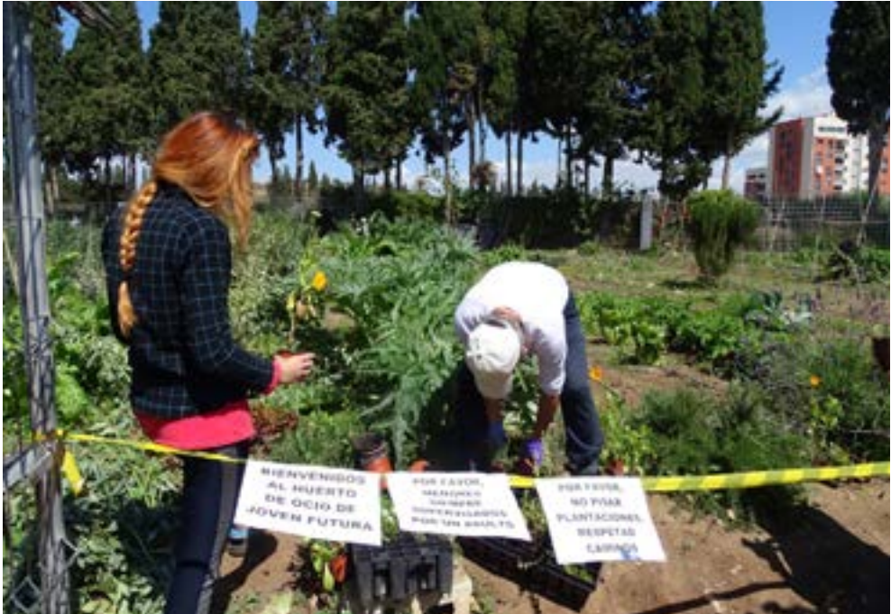
Cesión de plantas aromático-medicinales con flores para su integración dentro de los huertos (caléndula, orégano, lavanda).