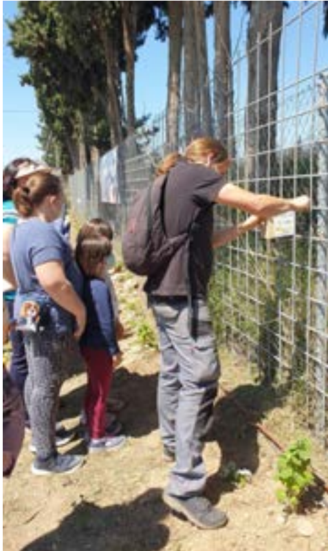
Colocación de refugios para polinizadores en huertos urbanos con la participación de vecinos en Joven Futura (Murcia).