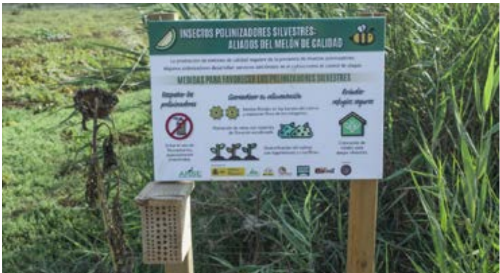
Señalización de acciones de fomento de los polinizadores en cultivo de melón. Se observa nidal y resto de banda floral (girasol).