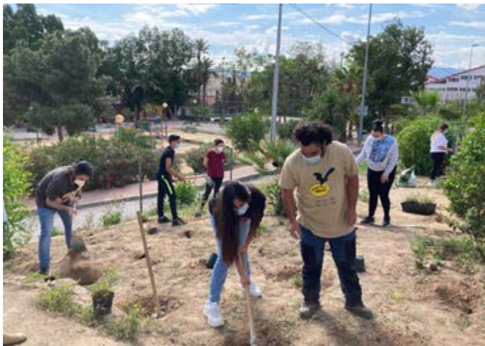
Plantación de especies atractivas para los polinizadores en el Colegio La Milagrosa (Espinardo, Murcia).