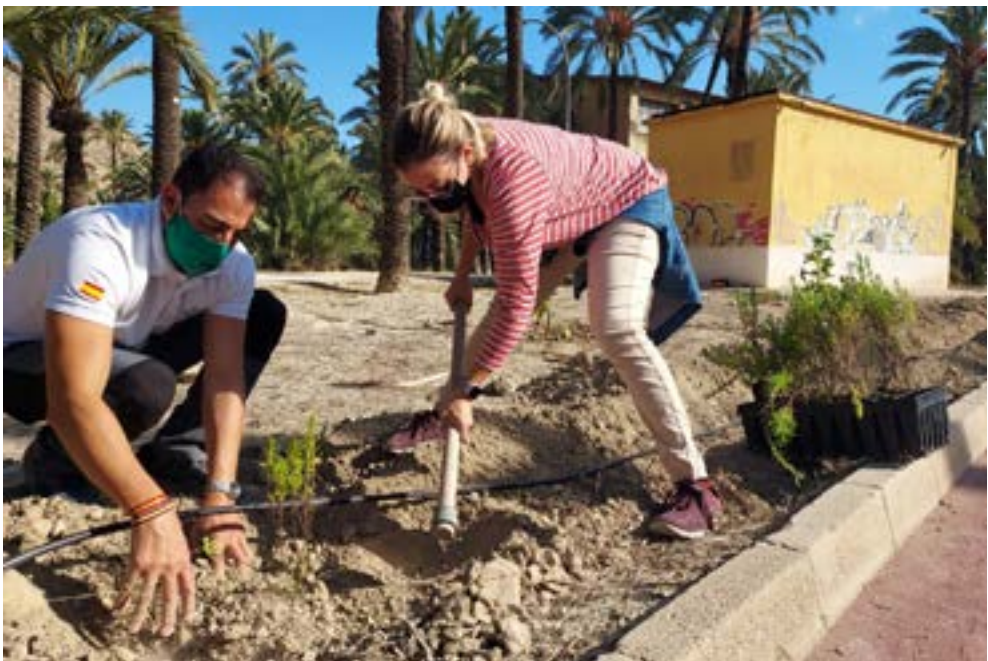
Concejales del Ayuntamiento de Orihuela plantando especies atractivas para los polinizadores.

avanzar en la implementación de la Estrategia Nacional. A través de estos convenios se ha promovido medidas para la conservación de polinizadores en zonas verdes, huertos urbanos y centros escolares.