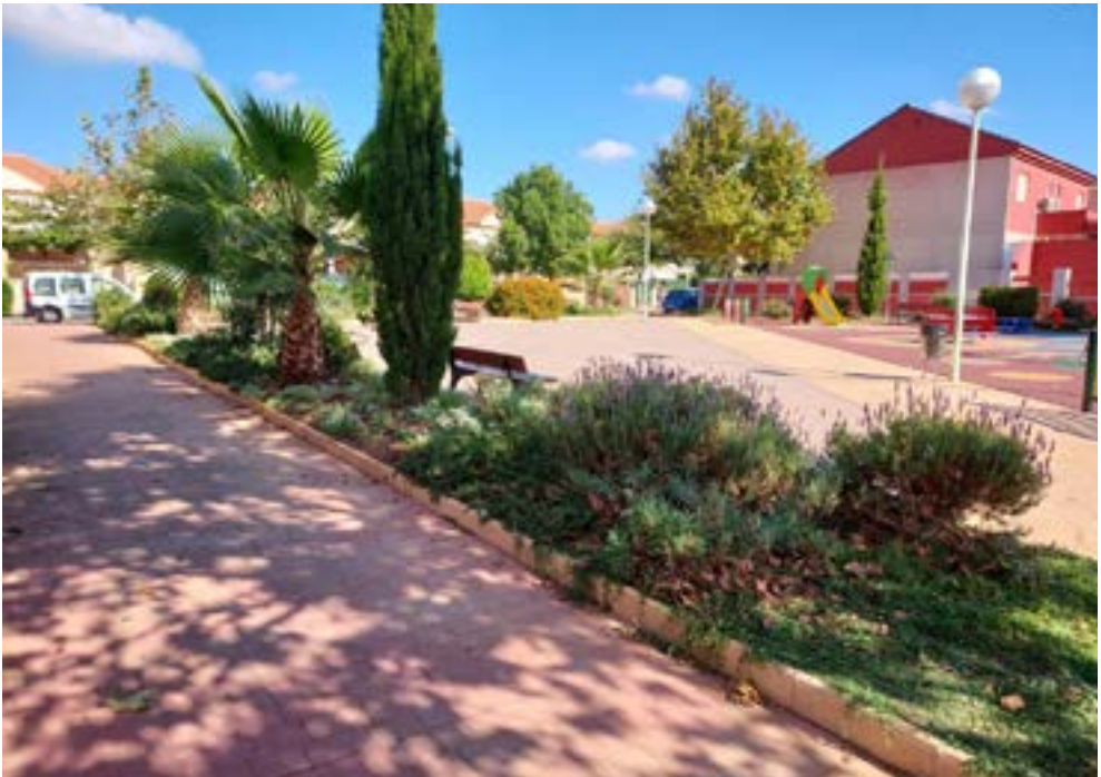
Antes y después de la intervención en Jardín del Bohío (Cartagena) con la introducción de Lippia nodiflora , Rosmarinus officinalis , Myrtus communis , Salvia officinalis , Lavandula dentata , Ballota hirsuta .