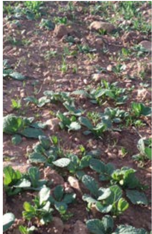
Germinación de banda floral en cultivo de cereal ( Borago officinalis , Vicia faba , Coriandrum sativum , Diplotaxis sp.pl. , etc.).