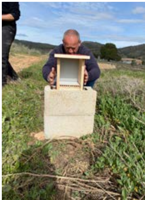
Instalación de nidales en campo para seguimiento.

En cada una de las localidades se realizaron tres muestreos: uno al mes de la instalación de los refugios, en junio de 2020, otro en invierno, momento en el que se recogieron muestras para identificar los polinizadores que emergían de los nidales y se sustituyeron por refugios nuevos, y un tercero en junio de 2021. En las revisiones en campo, se anotó el número de nidales que estaban siendo utilizados en cada refugio, registrando el estado en el que se encontraban los nidales (abierto, cerrado, destruido), el tipo de material utilizado para realizar el cerramiento (barro, hoja triturada, hoja cortada u otros materiales, p.ej. piedras, fibras de algodón, etc.) y si había hospedadores dentro del nidal (p.ej. abejas adultas, avispas, arañas, hormigas, heterópteros, etc.).