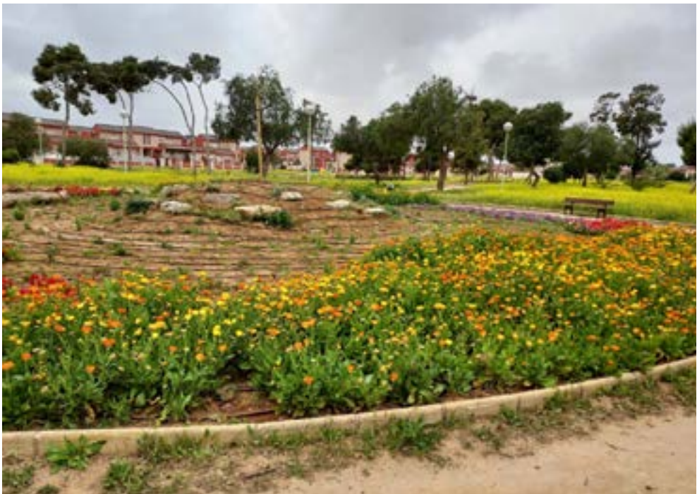
Antes y después de la intervención en la Pza. Escarihuela floración de Calendula officinalis y Lobularia maritima entre otras.