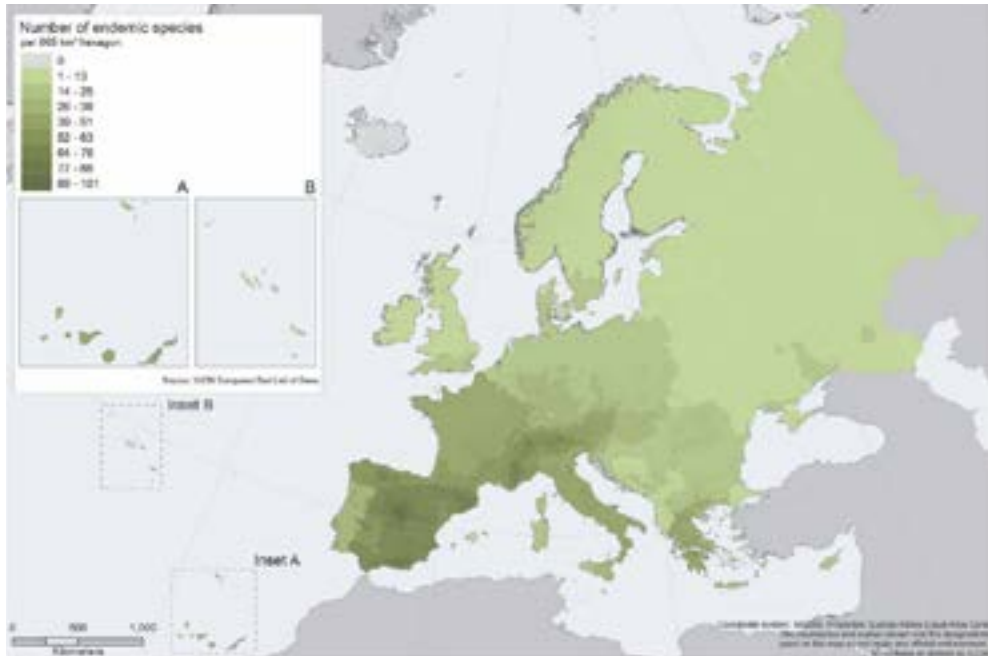
Distribución de abejas endémicas en Europa. Fuente: Nieto et al. (2014).