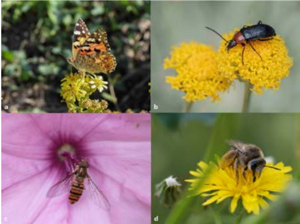
a) Mariposa Vanessa cardui ; b) Escarabajo Heliotaurus ruficollis ; c) Sífido Episyrphus balteatus ; d) Abeja Eucera notata .

polinizadores es que algunas especies son víctimas de un síndrome de polinización por engaño: determinadas especies de plantas aráceas, como Arisarum vulgare , producen un olor que recuerda a carne en descomposición y atraen a determinadas especies de moscas que realizan la polinización sin recibir recompensa (Aguado-Martín et al. 2015).