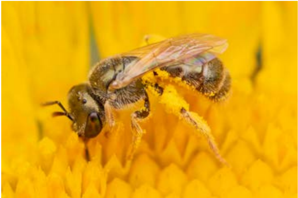
Abeja ( Seladonia gemmea ) recolectando polen.

las del género Lysimachia , producen aceites florales que son utilizados por algunas abejas solitarias como alimento o para impermeabilizar el nido (Aguado-Martín et al. 2015).