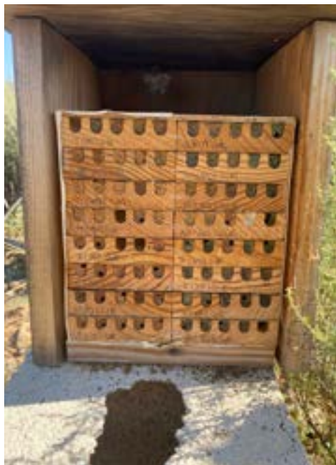
Nidales empleados.