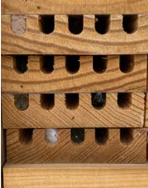
Nidales cerrados con distintos materiales (ej. Barro y hoja triturada) junto con ejemplar de Hoplitis sp. (Megachilidae) entrando en un nidal.

Los nidales que se recogieron durante el segundo muestreo, se colocaron en cajas perforadas transparentes y se introdujeron en cámaras climáticas a temperatura constante (25°C) y con un ciclo de luz 16:8. Los nidales se revisaron diariamente y se recogían los ejemplares que iban emergiendo, para su posterior identificación.