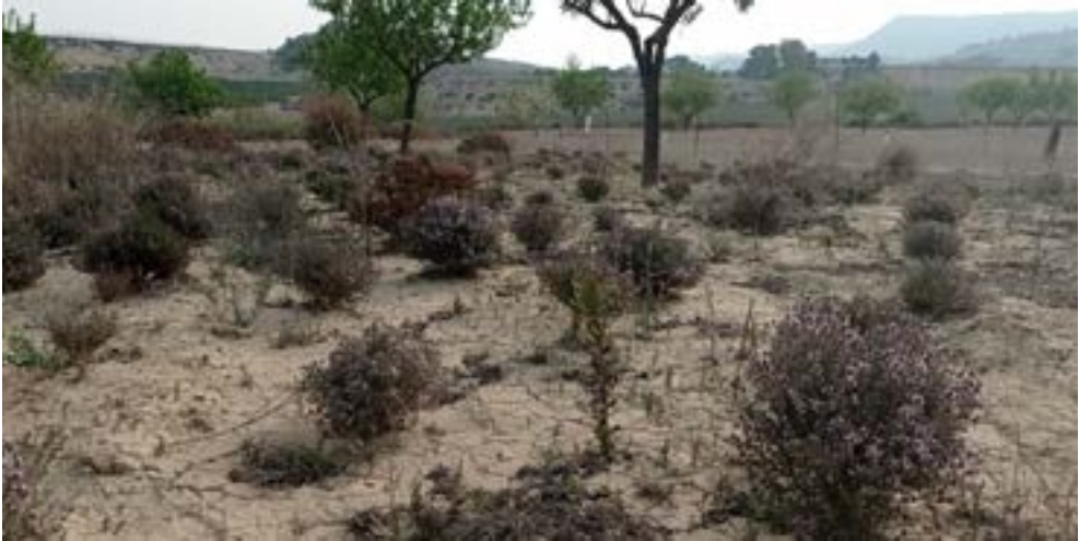
Policultivo leñoso de secano atractivo para polinizadores: aromáticas entre almendros.

varios servicios ecosistémicos como la productividad, el secuestro de carbono, la fertilidad del suelo, la disponibilidad de agua en el suelo, la reducción de plagas y enfermedades, o la presencia de polinizadores, entre otros. En relación a este último servicio ecosistémico, en cultivos leñosos de España, Alemania y Hungría se ha observado que la plantación de especies aromáticas como el tomillo, lavanda u orégano en las calles entre los árboles o en la línea de las viñas ha favorecido un incremento del número de polinizadores, hecho que pone de manifiesto los beneficios de estas especies en la atracción de este tipo de insectos beneficiosos.