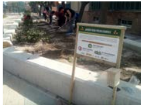
Jóvenes de Beniel plantando un jardín para polinizadores.