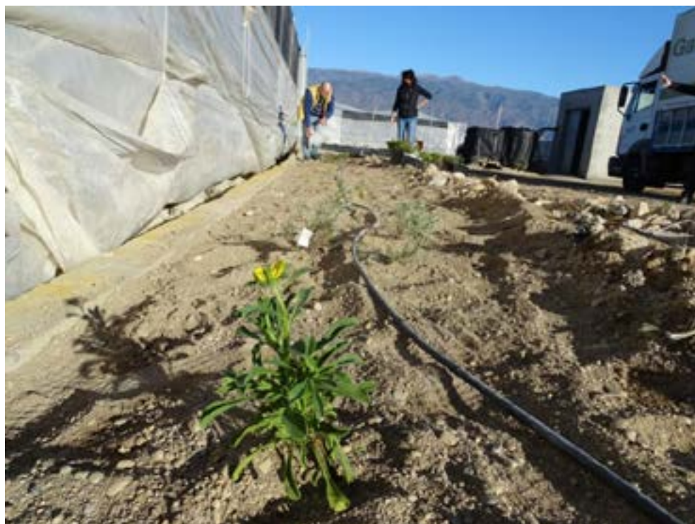
Plantas empleadas para favorecer la presencia de polinizadores en el entorno de los invernaderos ( Helichrysum stoechas , Asteriscus maritimus , Rosmarinus officinalis , Cistus albidus , Phlomis purpurea ).