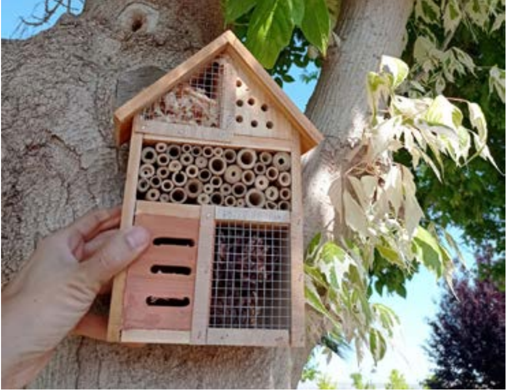
Instalación de hoteles para insectos en zonas verdes de la ciudad de Murcia.