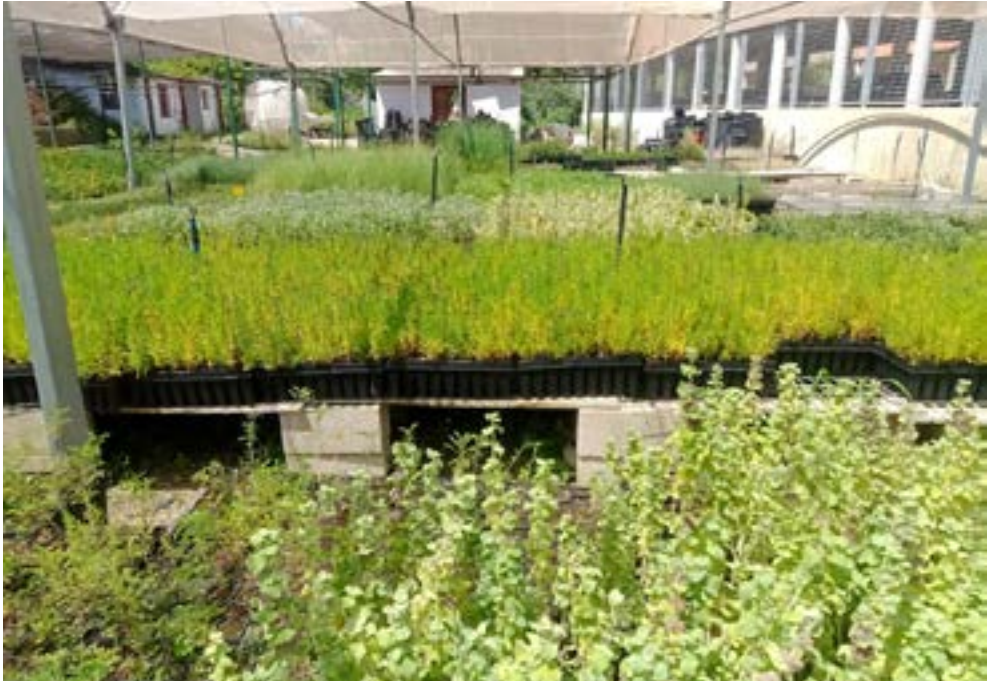
Vivero de producción de plantas autóctonas destinado a jardinería y restauración de espacios agrícolas.

con especies autóctonas como herramienta de prevención de nuevas invasiones. Finalmente, el documento relata otras amenazas para los polinizadores como el cambio climático, contaminación o enfermedades emergentes.