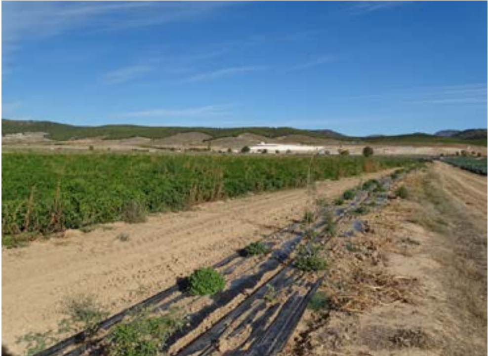
Seto en cultivo de regadío de pimiento ecológico ( Vitex agnus-castus , Salvia officinalis , Ballota hirsuta , Ori-ganum , etc.).