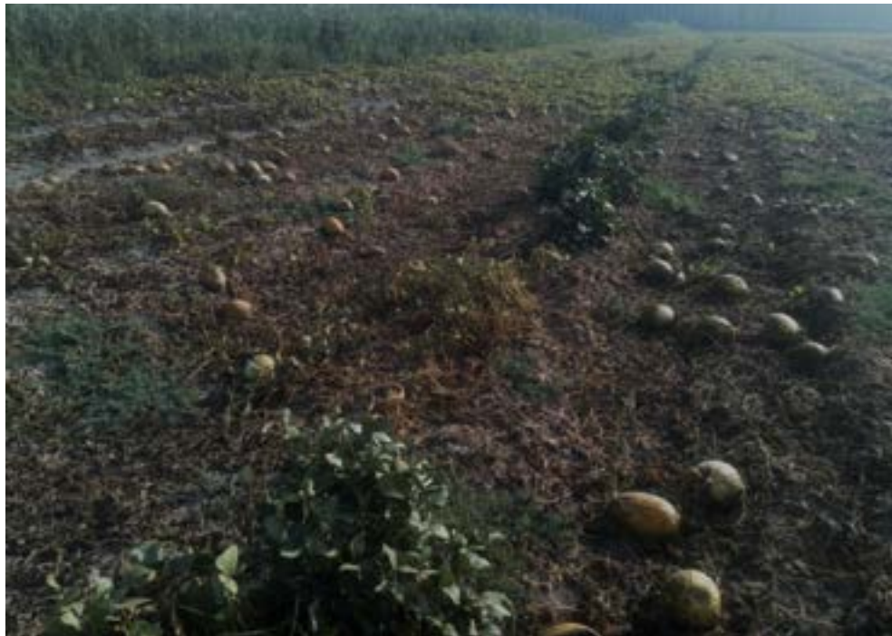
Diversificación de cultivos del melón para favorecer polinizadores. Arriba introducción de Lobularia maritima . Abajo, plantas de caupí destacan tras finalizar el cultivo del melón.