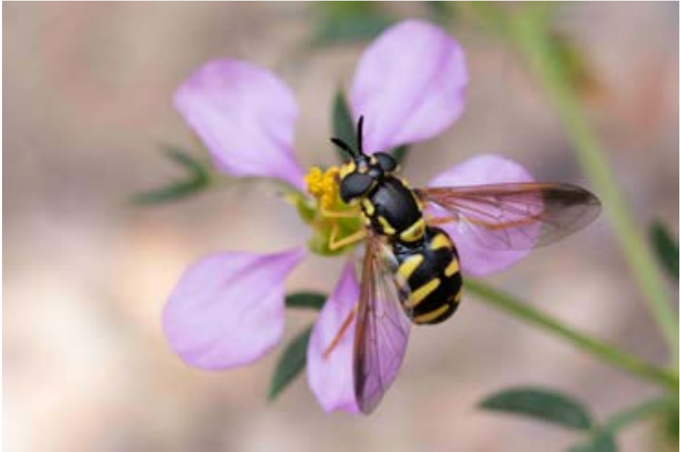
Sífido sobre flor de Fagonia cretica .

en el ámbito agrícola que contribuyan a la conservación de los polinizadores y de sus hábitats, con el fin de establecer adecuadas orientaciones y recomendaciones que contemplen las diversas intervenciones posibles según ámbitos geográficos, formas de cultivo, especies, etc.