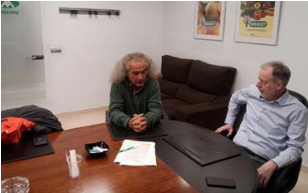
Firma de convenio con Anecoop, cooperativa que ha promovido las medidas de conservación de polinizadores en algunas de sus explotaciones.

Diferentes municipios de la Región de Murcia y de la provincia de Alicante se han sumado a la Red de Municipios por la conservación de los polinizadores con el objeto de