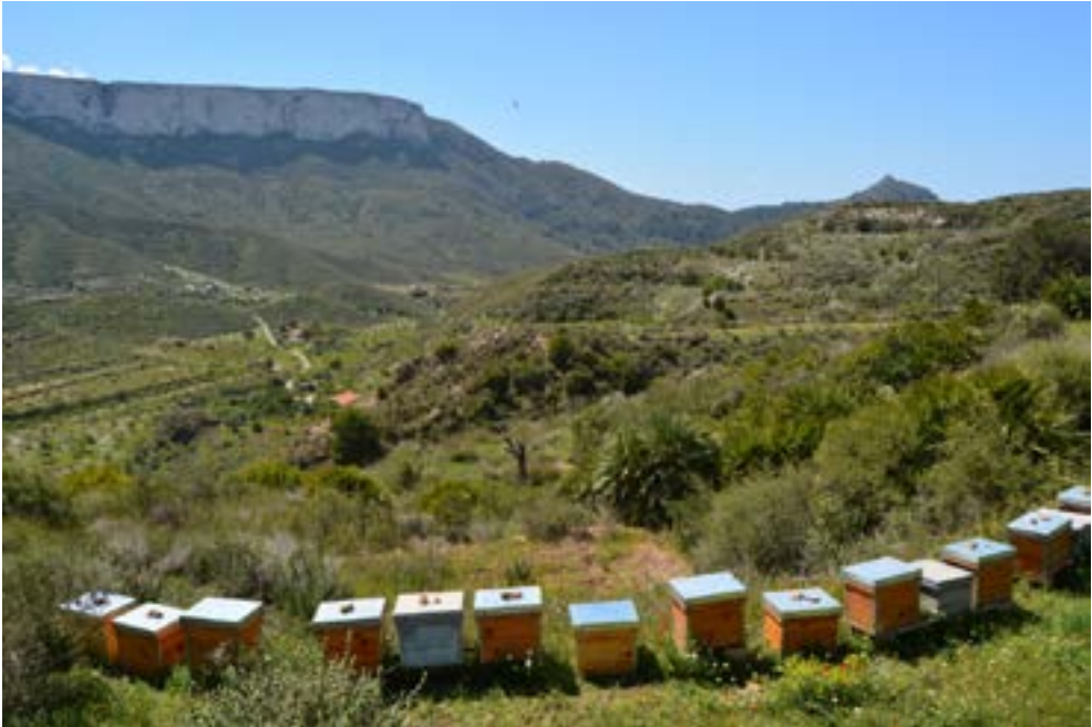
La adaptación de la apicultura al cambio climático es una de los objetivos de la Estrategia Nacional.