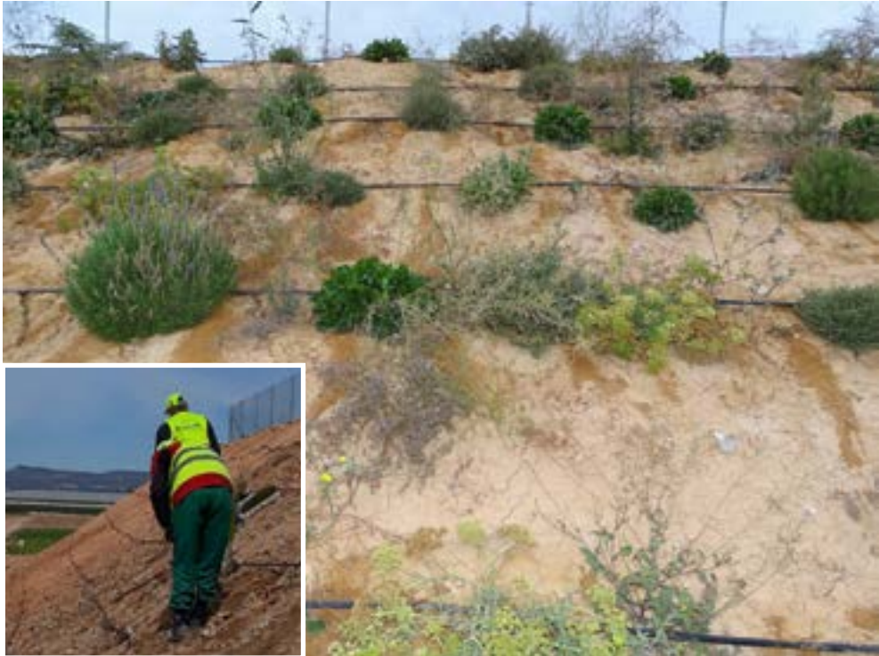
Momento de la plantación de un talud desnudo y resultado tras unos meses. Se aprecia especies de floración escalonada tales como hinojo marítimo ( Crithmum maritimum ), Limonium sp.pl., lavanda ( Lavandula dentata ), matagallo ( Phlomis purpurea ), etc.