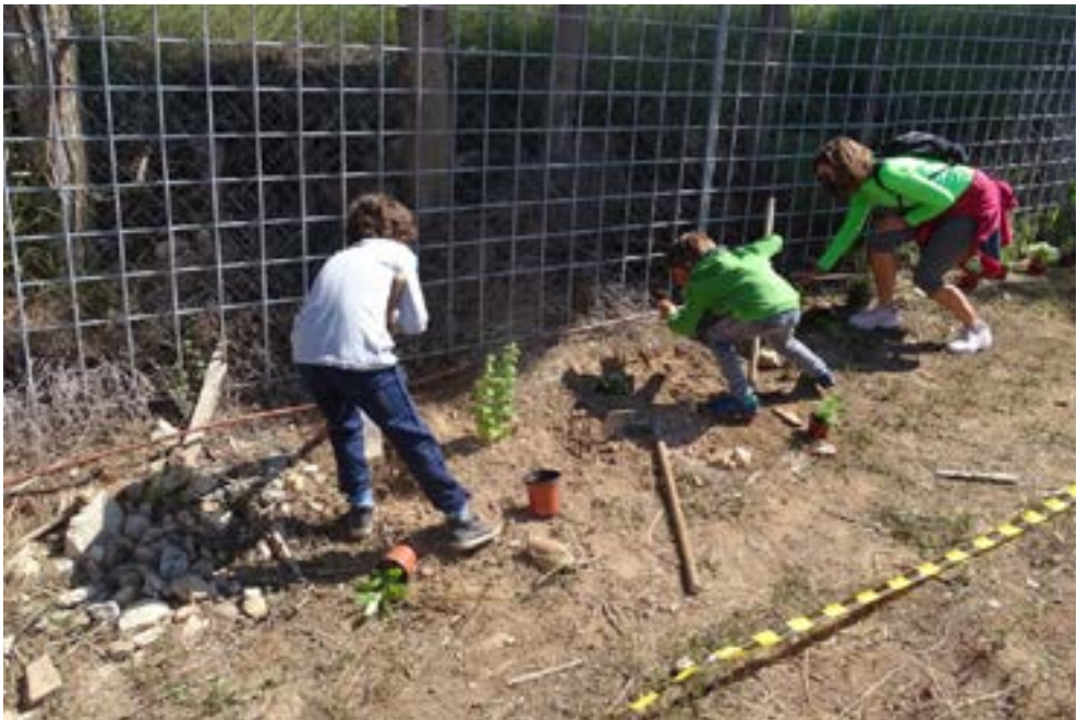
Plantación de seto perimetral con especies de flores a los Huertos de Joven Futura (Murcia) se aprecian matagallos ( Phlomis purpurea ), manrubio ( Ballota hirsuta ) y Lobularia maritima.