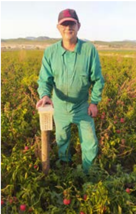
Colocación de nidales para abejas solitarias en cultivos de pimiento ecológico.