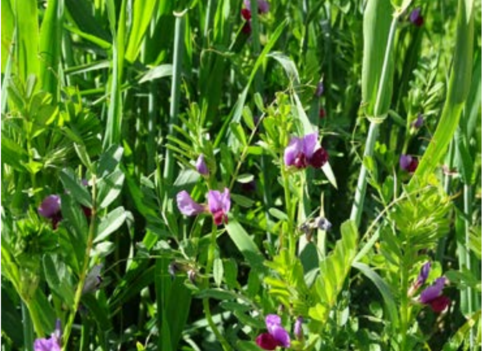
Las leguminosas como esta veza ( Vicia sativa ) aparecen recogidas como especies atractivas para las abejas.

orientado al suministro de recursos para abejas domésticas para la producción de miel se excluyeron determinados géneros como Borago , Senecio , Echium y Senecio por contener alcaloides. Igualmente y por razones obvias quedaron excluidas expresamente las especies exóticas invasoras.