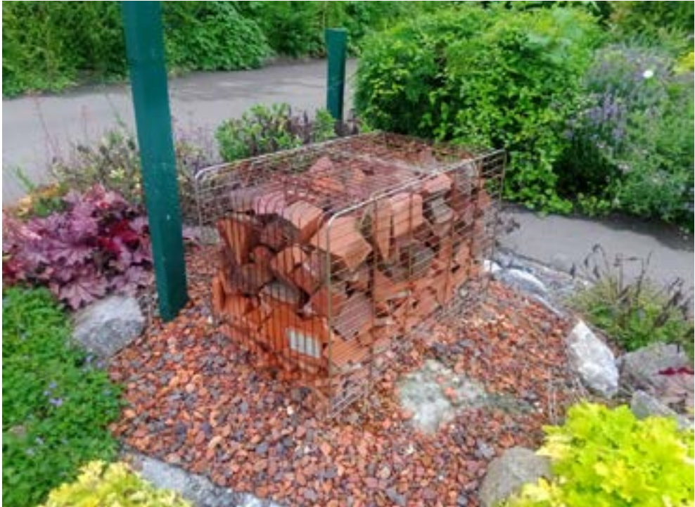
La adopción de medidas para el fomento de la biodiversidad en zonas verdes es una constante en diversas ciudades europeas (París).

ejemplo, los parches de zarza y hiedra proporcionan un hábitat importante de alimento y refugio, e incluso las conocidas como “malas hierbas” en flor son un valioso recurso de néctar y polen.