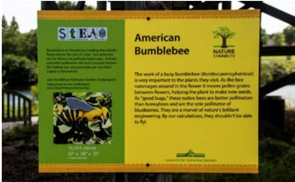
Cartel del Million Pollinator Garden Challenge en el Lewis Ginter Botanical Garden.