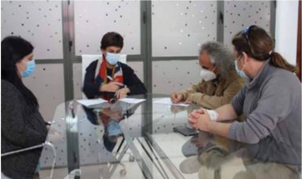
Firma de convenio con el Ayuntamiento de Beniel.

avanzar en la implementación de la Estrategia Nacional. A través de estos convenios se ha promovido medidas para la conservación de polinizadores en zonas verdes, huertos urbanos y centros escolares.