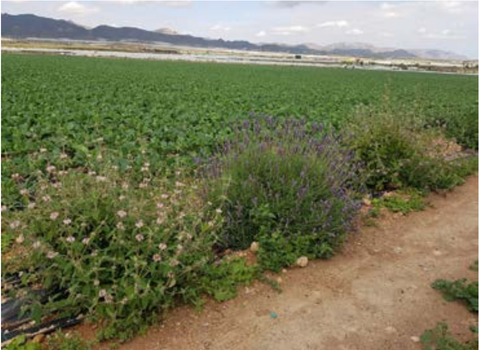
Seto multifuncional en área agrícola intensiva con especies atractivas para polinizadores ( Lavandula dentata y Phlomis purpurea ).

previamente, con el fin de favorecer las poblaciones de insectos polinizadores y auxiliares. Cuenta con el apoyo de la Fundación Biodiversidad del Ministerio para la Transición Ecológica y SYNGENTA.