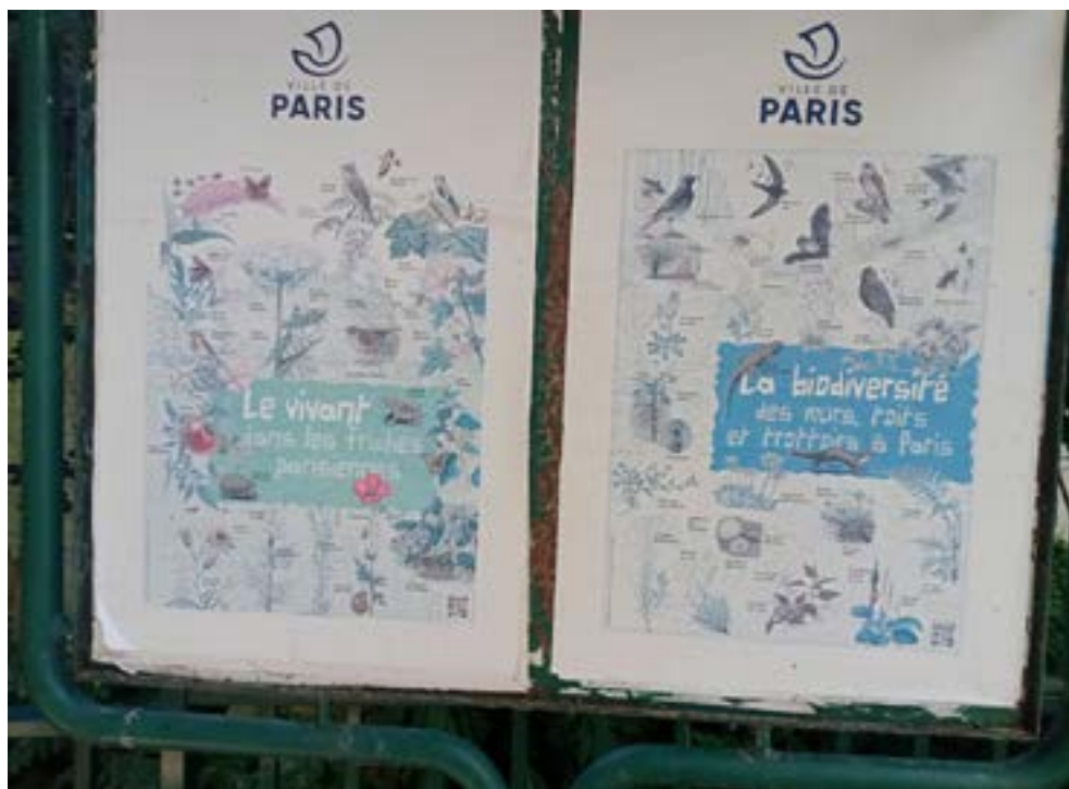
La conservación de la biodiversidad en espacios urbanos puede contribuir a mejorar el estado de conservación de los polinizadores.

12. Conseguir que no se utilicen plaguicidas químicos en zonas sensibles, como los espacios verdes urbanos de la UE.