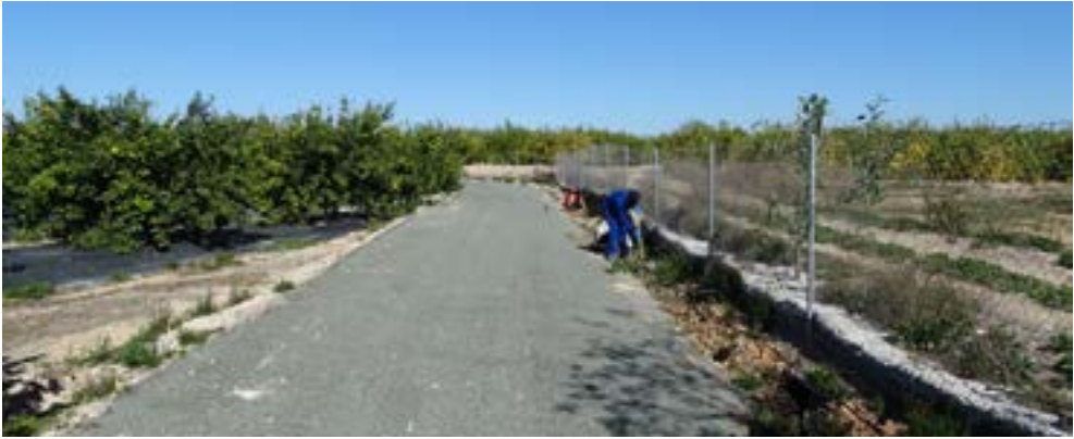
Plantación de seto cortavientos perimetral.