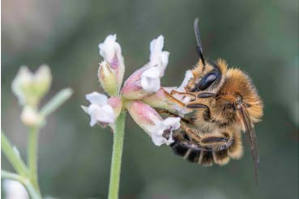
Abeja alimentándose en flor de Dorycnium pentaphyllum .