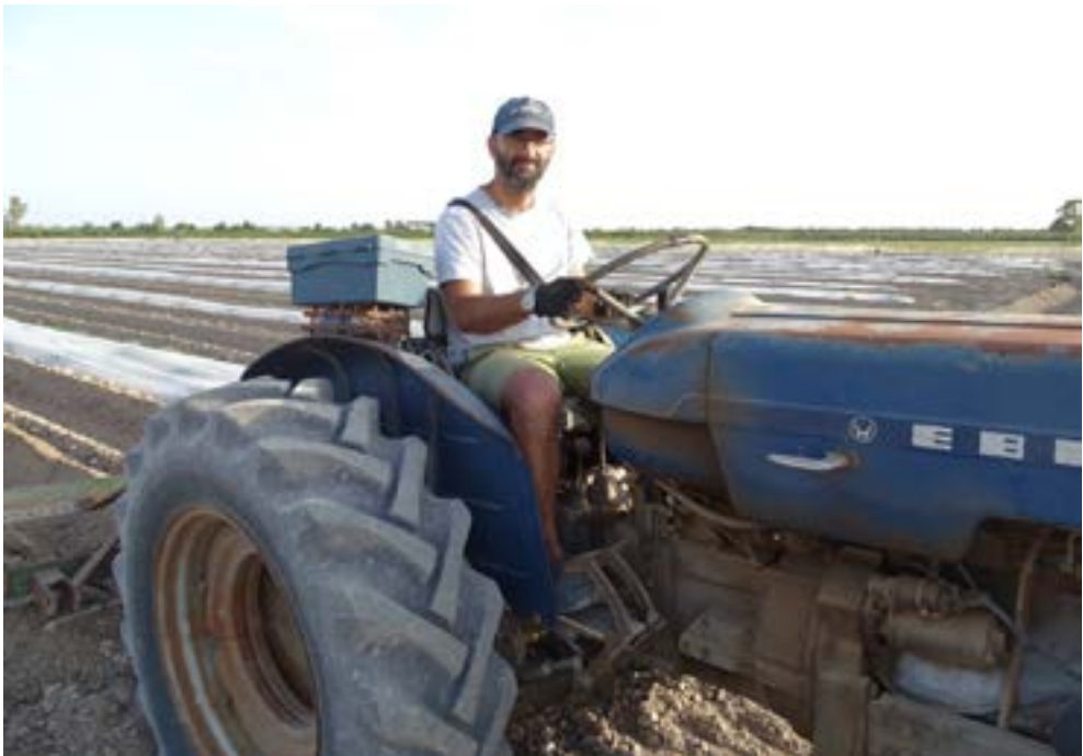
Las labores agrícolas (no sólo las fumigaciones) pueden tener efectos sobre las poblaciones de polinizadores.

La reducción de la intensidad en el manejo de las explotaciones con acciones tales como reducir uso de fitosanitarios (Brittain et al. 2010; Kindemba, 2009, Shuler et al. 2005), reducción de periodicidad de siegas/desbroces (Knop et al. 2006) o reducir la presión ganadera (Kruess & Tschardtke 2002) son medidas habitualmente recomendadas en la mejora de las poblaciones de polinizadores.