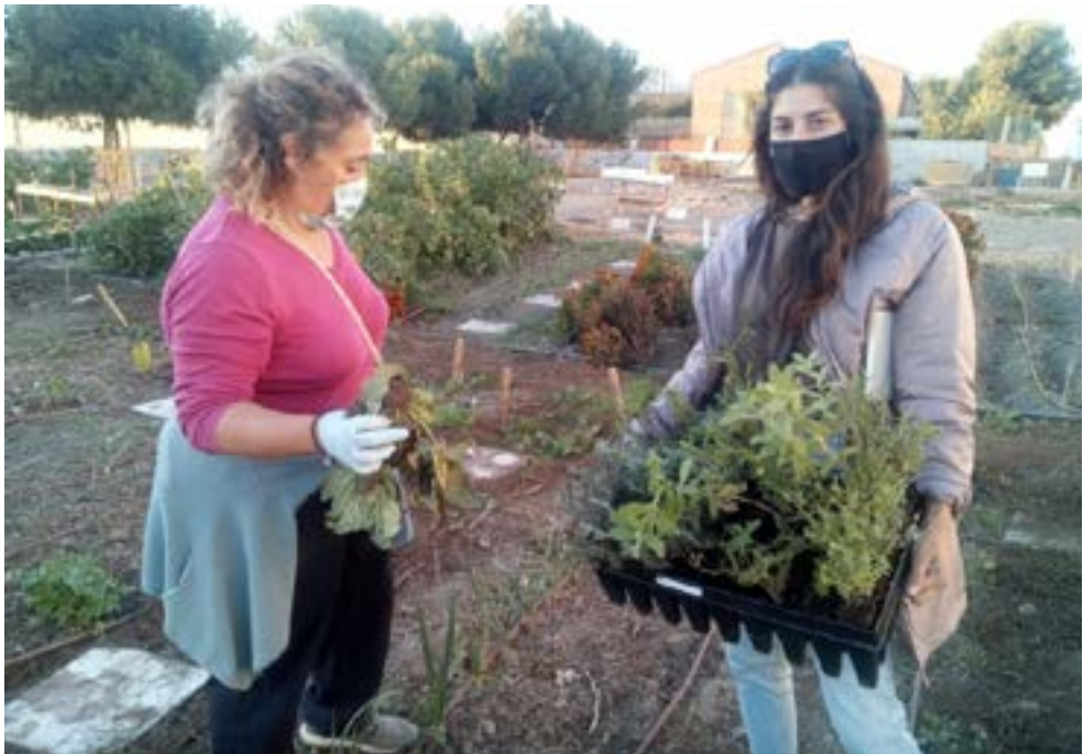
Plantas para fomentar los polinizadores en Huertos de Cultivando San Antón (Cartagena) se observan matagallos ( Phlomis purpurea ), diversas jaras ( Cistus sp.pl. ), manzanilla borde ( Santolina chamaecyparissus ), orégano ( Origanum sp. ) y siempre viva ( Helichrysum stoechas ).