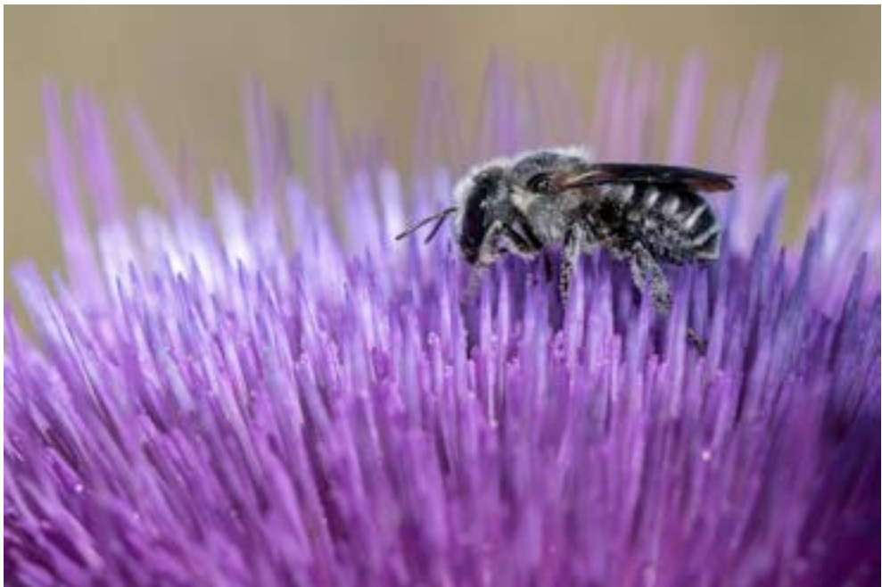
Abeja Osmia niveocincta .

Además, hay que tener en cuenta que los beneficios que aportan los polinizadores en la agricultura no son los únicos que nos proporcionan. Los polinizadores nos aportan también numerosos servicios ecosistémicos debidos sobre todo a que favorecen la reproducción de las plantas silvestres y contribuyen al mantenimiento de la diversidad vegetal. Al favorecer a las plantas, también favorecen a todos los herbívoros, frugívoros, parásitos, etc., que se alimentan de ellas. Y, además, de forma indirecta, contribuyen a todos los servicios ecosistémicos que nos proporcionan las plantas, como formación de suelos, reciclado de nutrientes, aumento de la infiltración de agua, protección contra la erosión, etc. Por otro lado, los polinizadores sirven de alimento a multitud de aves,