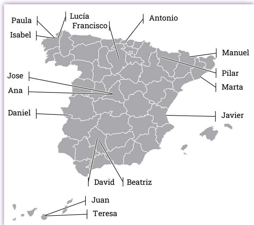
Figura 1. Distribución geográfica de las 16 personas participantes en el estudio

A continuación se presentan los perfiles de las personas participantes, utilizando nombres y avatares ficticios al considerar que su identidad no es relevante para los objetivos del estudio.